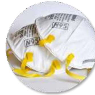
Masker N95: Tenaga Medis