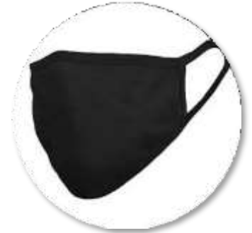
Masker Kain 3 Lapis: Masyarakat