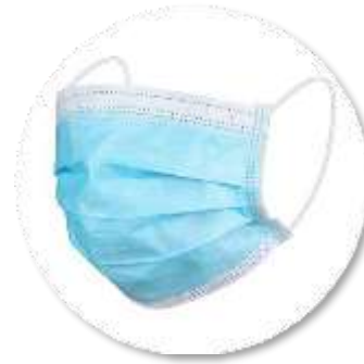
Masker Medis: Orang Sakit dan Tenaga Medis